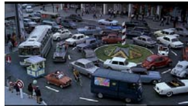
Play-time. Jacques Tati