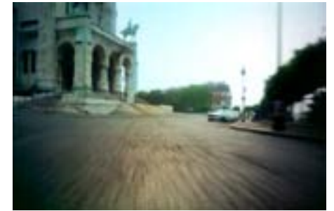
Claude Lelouch « C'était un rendez-vous »