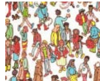
Mais où est Charlie ?